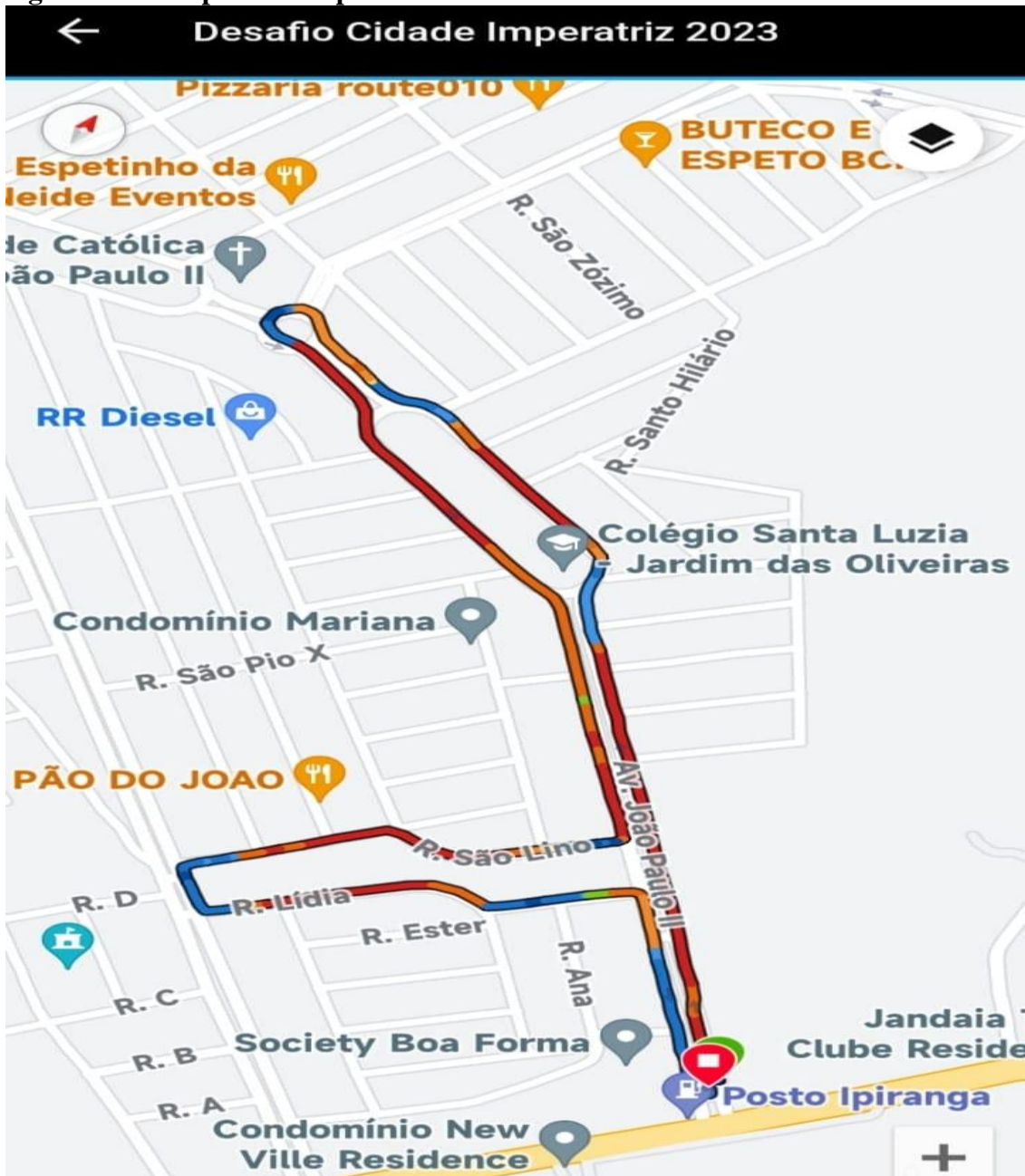
Figura 2: Visão padrão do percurso